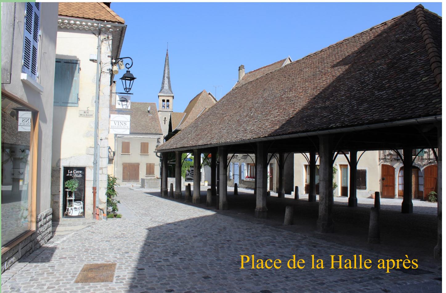
Place de la Halle après