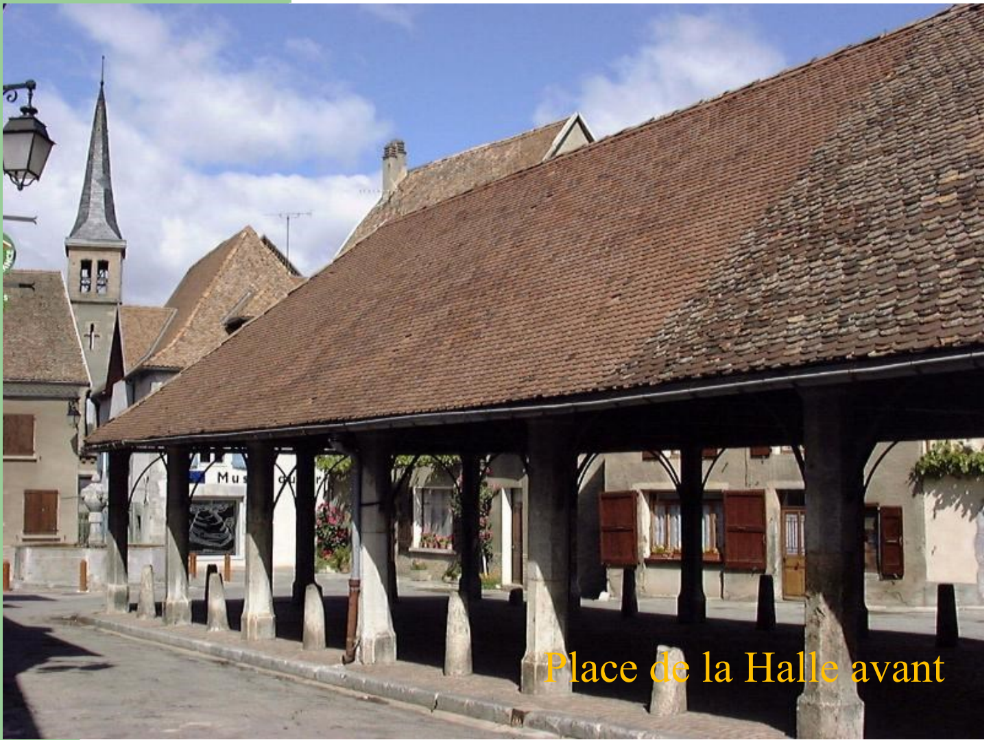
Place de la Halle avant