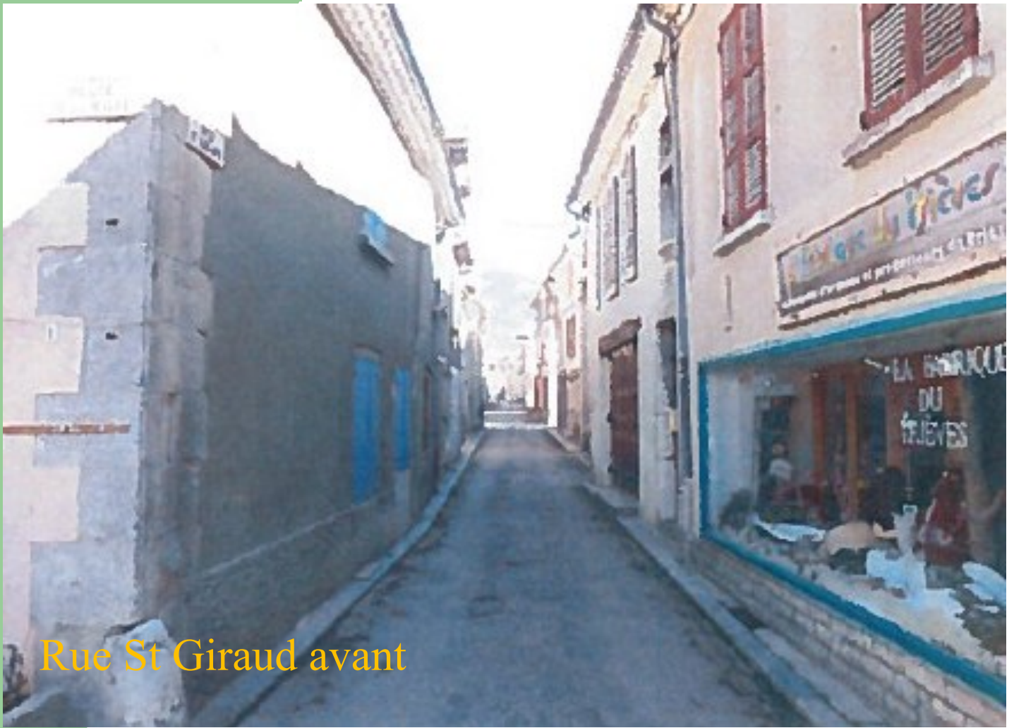
Rue St Giraud avant