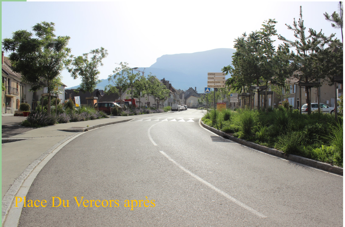
Place Du Vercors après