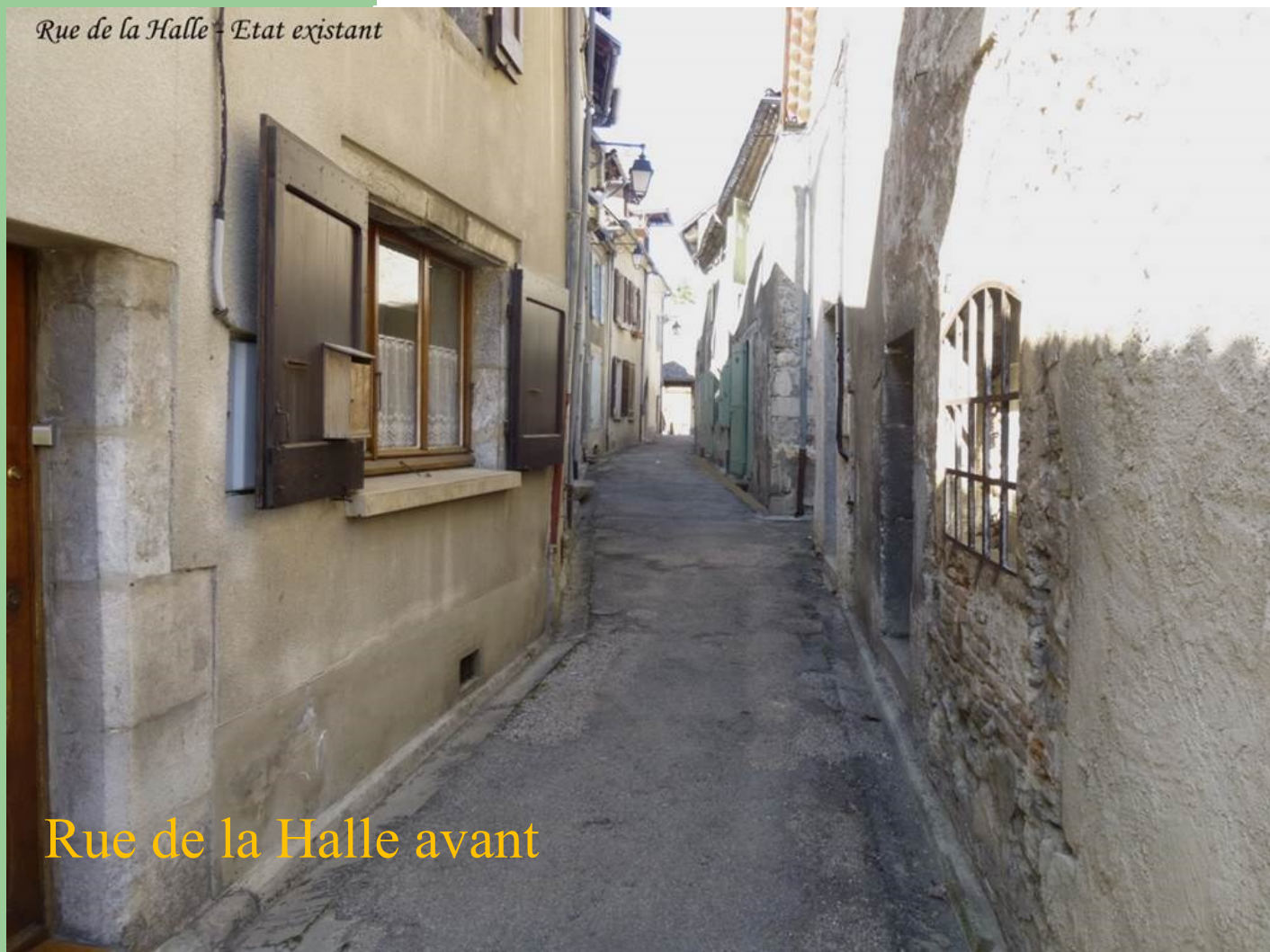
Rue de la Halle avant