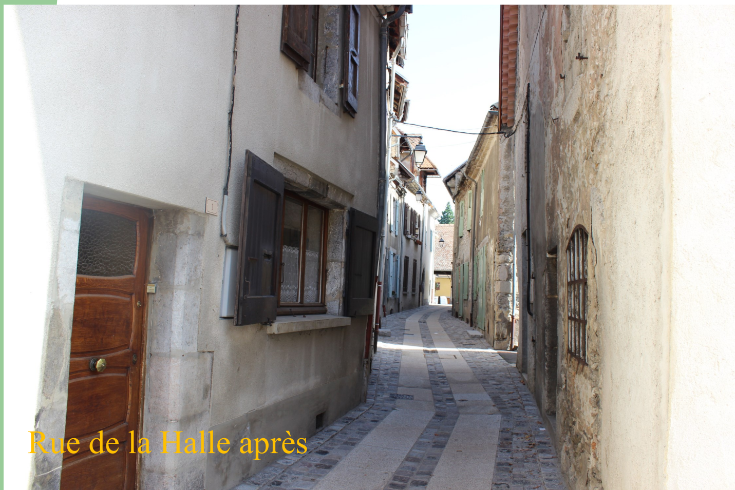
Rue de la Halle après