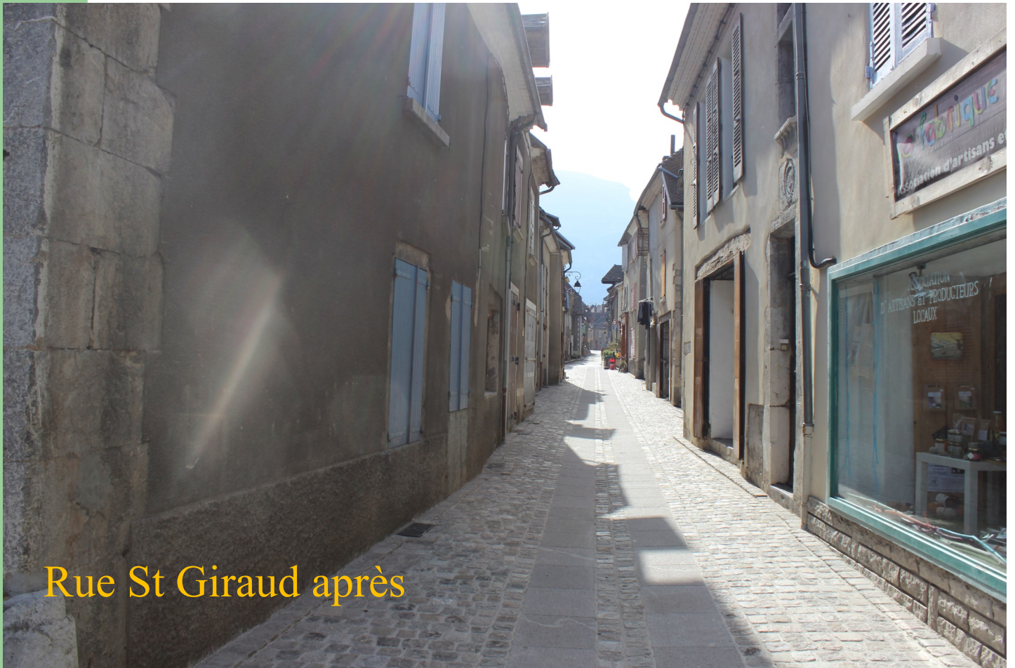
Rue St Giraud après