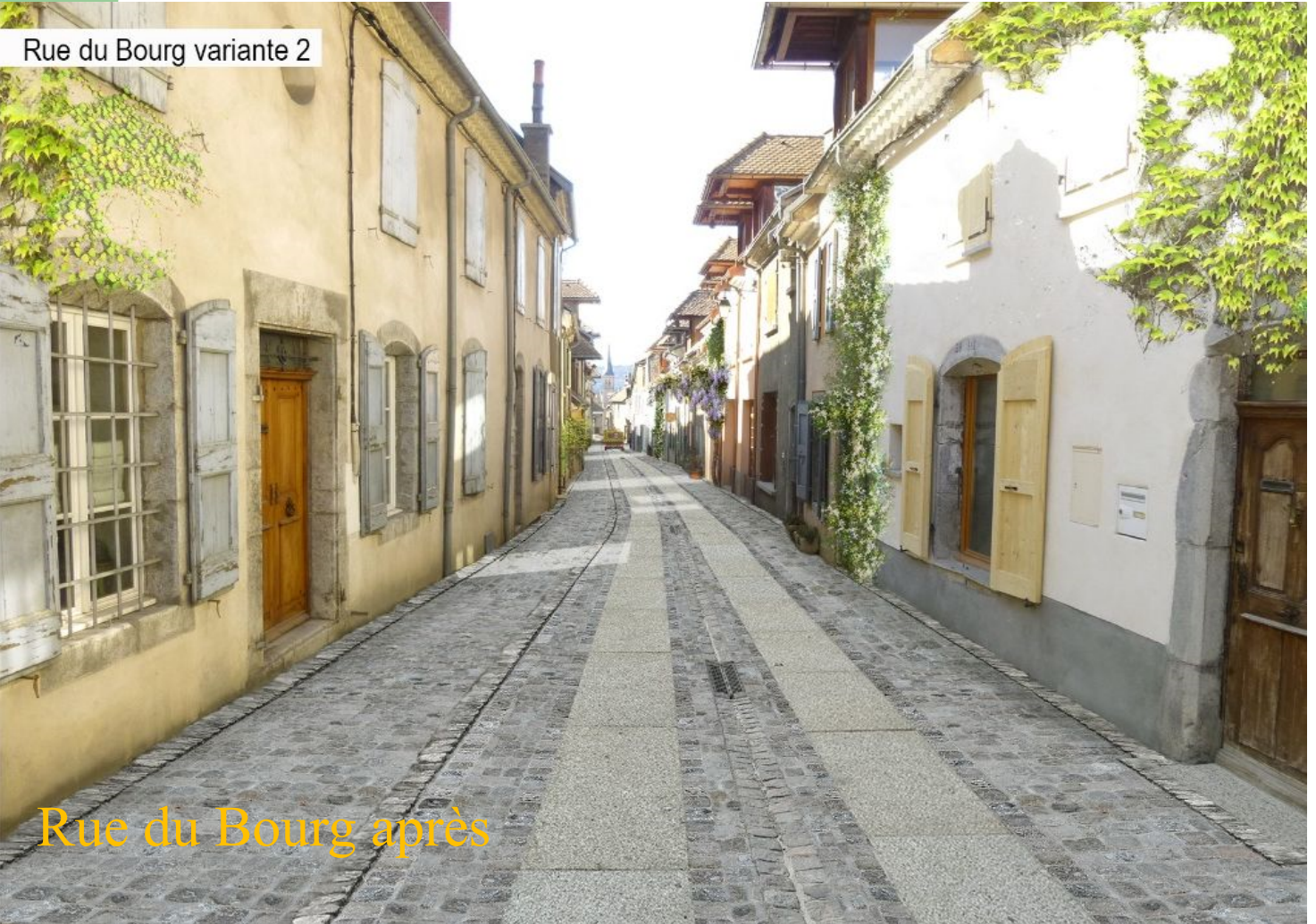
Rue du Bourg variante 2