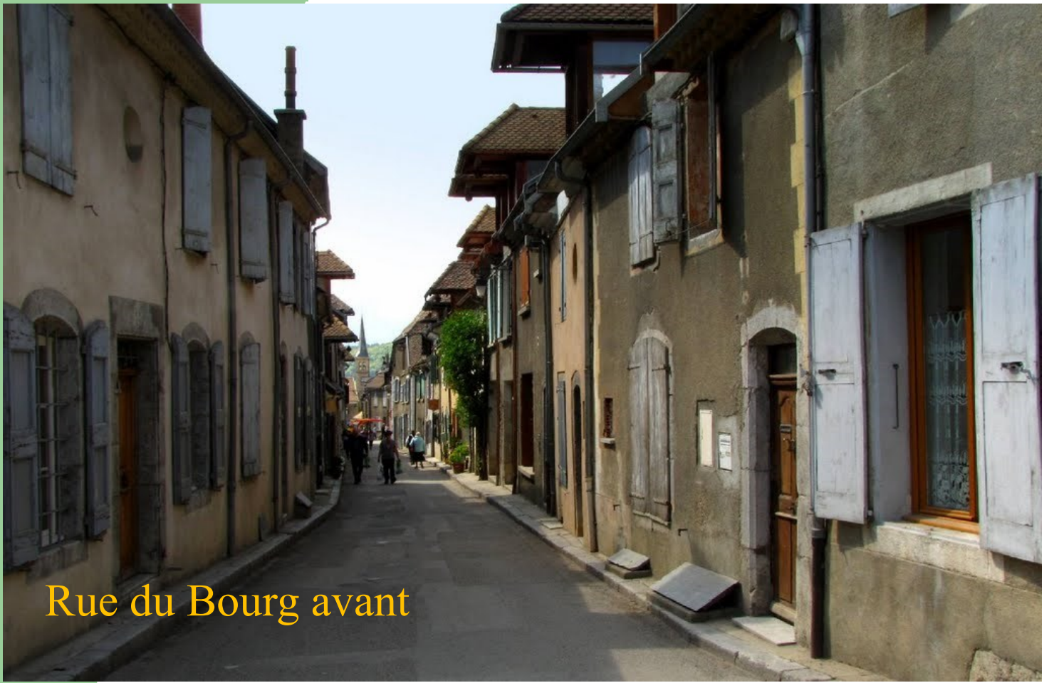
Rue du Bourg avant