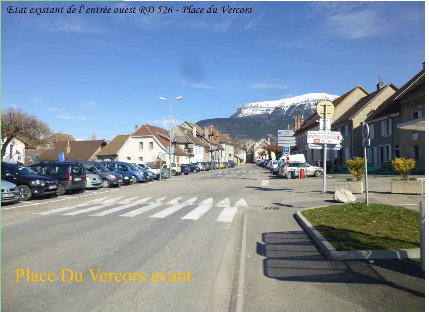
Place Du Vercors avant