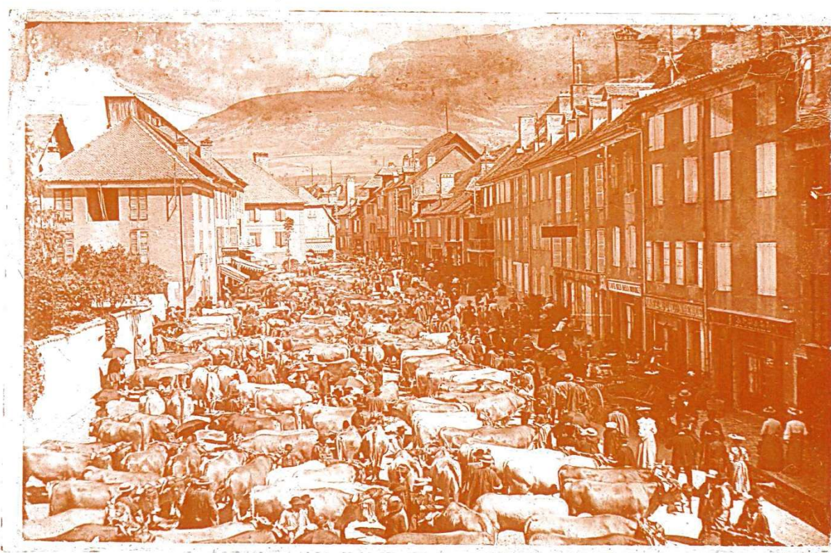
le Grand Breuil