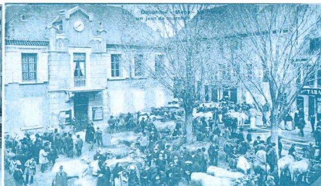
Place de la mairie