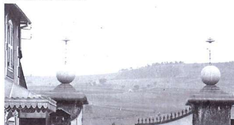
Les deux lampes du portail de l'usine de soierie

La durée est de 18 ans, renouvelée en 1920, et revue en 1936.