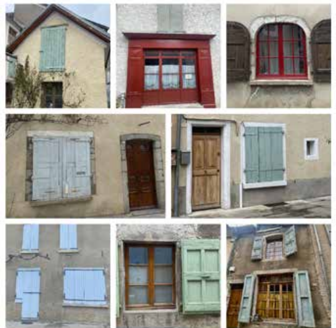
Quelle couleur pour vos volets ? Un nancier est disponible en mairie !

Le travail d'accompagnement fait avec la Direction des finances publiques nous montre une gestion budgétaire saine et de bons ratios comparativement aux communes de la même catégorie. Nous présenterons ces indicateurs dans le TUM de mai.