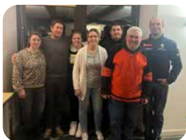
SPORTIVEMENT L'ÉQUIPE DU CORAT