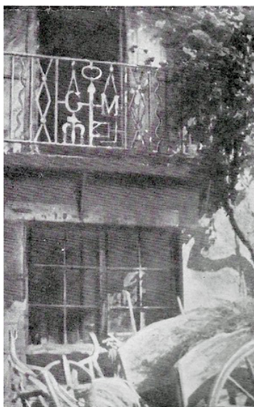
Vieux balcon en fer forgé de Mens (Isère) où l'on distingue un marteau et deux faucilles.

Les Amis du Musée du Trièves sont toujours à la recherche d'informations sur l'histoire de notre pays. On trouve beaucoup de renseignements dans des papiers pouvant sembler anodins : factures, lettres, cahiers d'écolier... ou, comme c'est le cas ici, des articles de journaux.