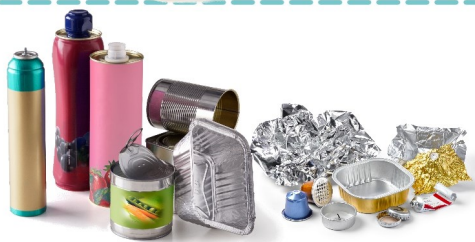
Tous les emballages métalliques