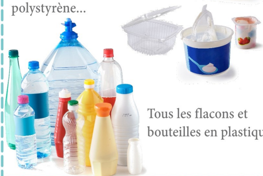
Tous les flacons et bouteilles en plastique