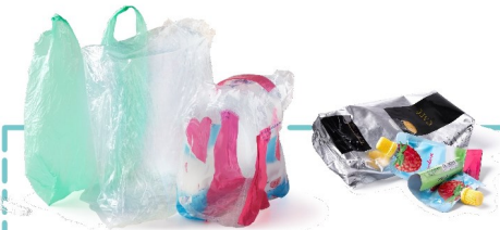
Tous les emballages en plastique : pots, sacs et films souples, barquettes plastiques ou polystyrène...