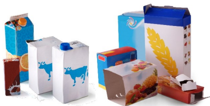
Tous les cartons et briques alimentaires