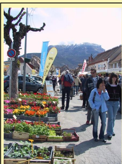
Tôt le matin, déjà de nombreux visiteurs