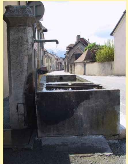
La rue Louis Rippert

Les deux usines n'ayant pu être dotées des nouveaux métiers à tisser, trop coûteux, durent fermer leurs portes. Celle de la rue Louis Rippert, dirigée alors par Jean, fils d'André, ferma en 1962.