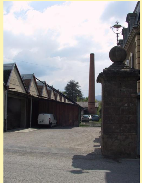
L'usine de soierie